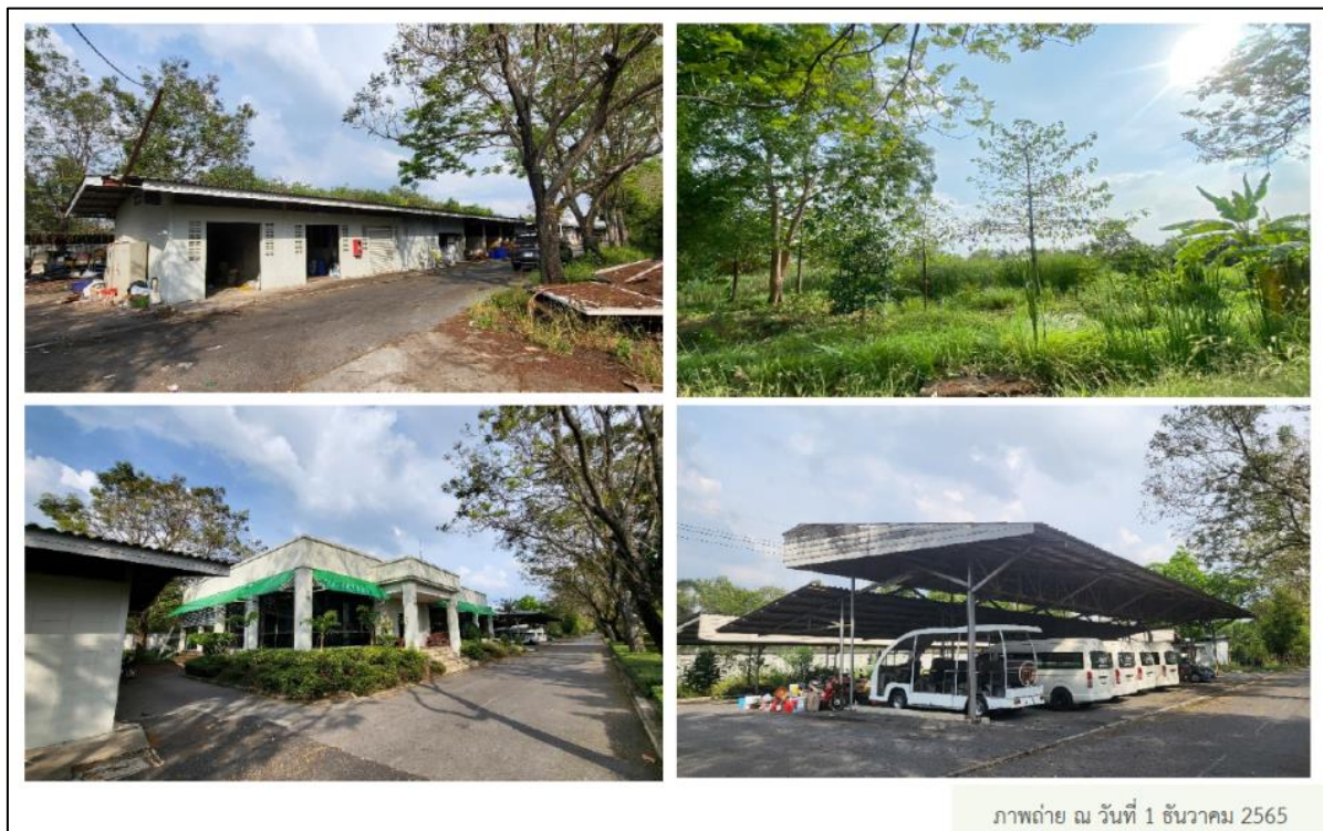
รูปที่ 1-4 สภาพพื้นที่ว่าง รั้วคอนกรีต คสล. (กำแพงป้องกันน้ำท่วม) คูระบายน้ำ ต้นไม้ กลุ่มอาคารเดิม ขนาดชั้นเดียว จำนวน 3 อาคาร โครงหลังคาที่จอดรถ พื้นที่เก็บของ และพื้นที่คอนกรีต ค.ส.ล.

จากสภาพพื้นที่โครงการ ณ วันที่ 1 ธันวาคม 2565 เป็นพื้นที่ว่าง รั้วคอนกรีต คสล.(กำแพงป้องกันน้ำท่วม) คูระบายน้ำ ความกว้างประมาณ 4 เมตร ต้นไม้ กลุ่มอาคารเดิม ขนาดชั้นเดียว จำนวน 3 อาคาร โครงหลังคาที่จอดรถ พื้นที่เก็บของ และพื้นที่คอนกรีต ค.ส.ล. ซึ่งจะดำเนินการล้อมย้ายต้นไม้ภายในพื้นที่โครงการออกทั้งหมด และรื้อถอนอาคารเดิม โครงหลังคาที่จอดรถ พื้นที่เก็บของ และพื้นที่คอนกรีต ค.ส.ล. ดังกล่าว ทั้งนี้ โครงการจะต้องทำการรื้อถอนอาคารเดิม และล้อมย้ายต้นไม้ภายในพื้นที่โครงการ ก่อนดำเนินการก่อสร้างโครงการ โดยในการรื้อถอนคาดว่าจะใช้เวลาประมาณ 2 เดือน ดังแสดงในรูปที่ 1-4