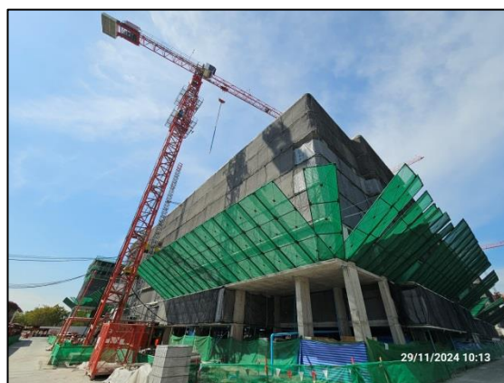
รูปที่ 1-3 สภาพปัจจุบันของโครงการ